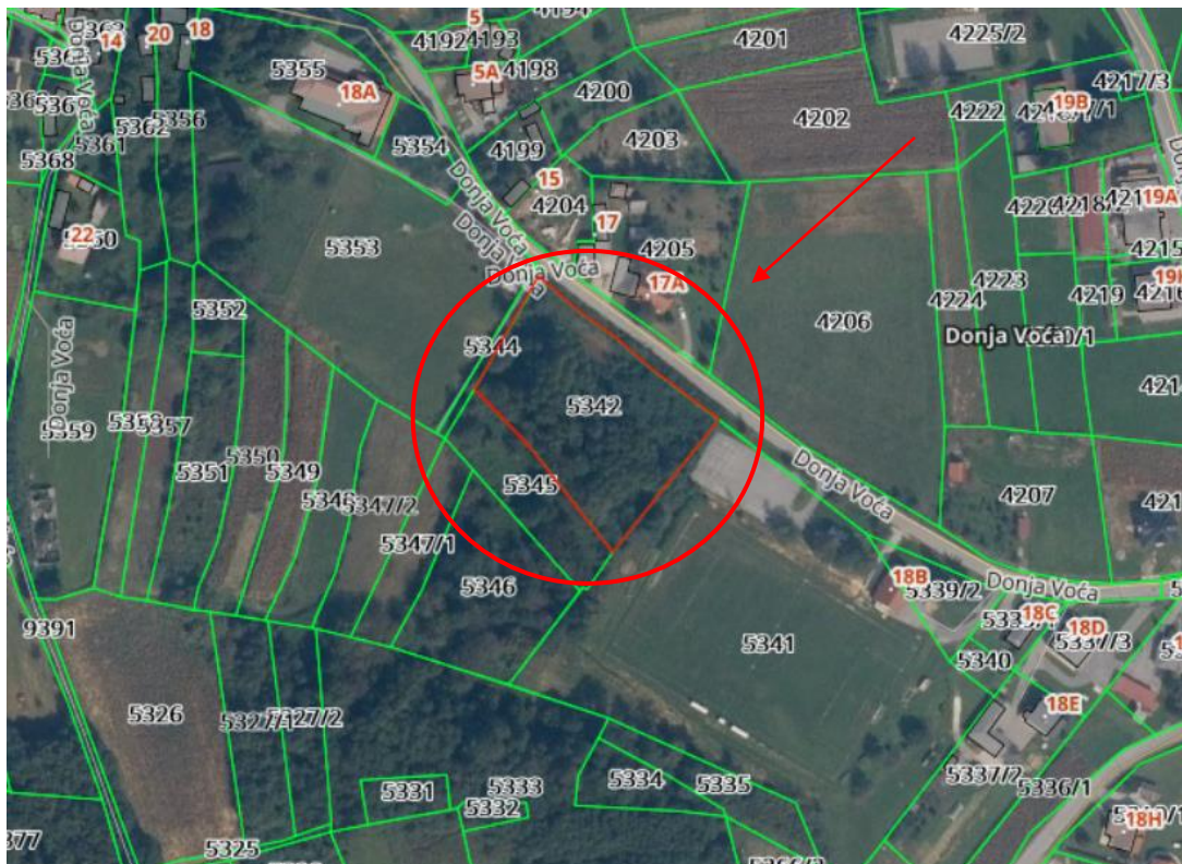
Slika: Ortofoto snimak područja nekretnina

Lokacija: Predmetna nekretnina na k.č.br. 5342 k.o. Donja Voća nalazi se u Varaždinskoj županiji, unutar građevinskog područja naselja – neizgrađeni dio.